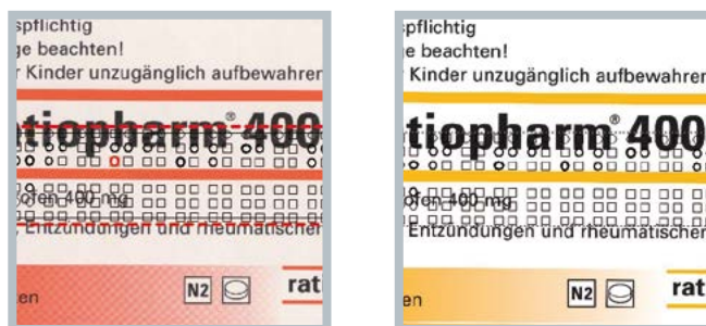
Beispiele einer Braille- (Blindenschrift-) Prüfung