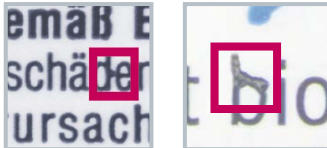
Beispiele von Druckfehlern bei Schriften

Selbstklebende Etiketten finden in vielen Bereichen der Industrie Verwendung. Manche sind sehr einfach und haben einen geringen Qualitätsanspruch, andere dagegen sind sehr hochwertig und haben einen hohen Anspruch an die Qualität. In beiden Fällen ist der EyeC Profiler eine große Hilfe beim schnellen Einrichten der Druckmaschine und gewährleistet eine zuverlässige Qualitätskontrolle. Nachdem die ersten Drucke mit den Kundenvorgaben verglichen wurden, können Sie sicher sein, dass der Auftrag auf Anhieb richtig gedruckt wird.