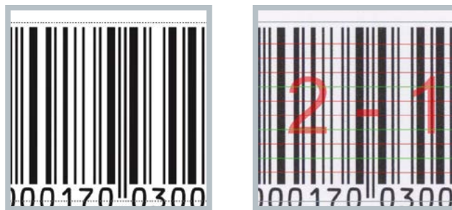
Beispiele einer Barcode-Prüfung

Ein wesentlicher Schritt der Faltschachtelprüfung ist die automatische Erkennung der Stanz- und Falzkanten, denn nur mit dieser Information lässt sich der Inhalt präzise prüfen. Die EyeC Stanzkantenerkennung ermöglicht diesen Schritt sicher und automatisch mit fast allen möglichen PDF-Eingangsformaten, beispielsweise im ECMA-Standard, mit Ebenen, Spotfarben oder als einfarbige Konturlinie. Neben der Prüfung des Textes und der Grafiken sind Barcode-Prüfung und Braille- (Blindenschrift-) Prüfung häufig notwendige Bestandteile der integrierten Qualitätsprüfung von Faltschachteln. Der EyeC Profiler ermöglicht alle diese Prüfungen in einem Arbeitsschritt.